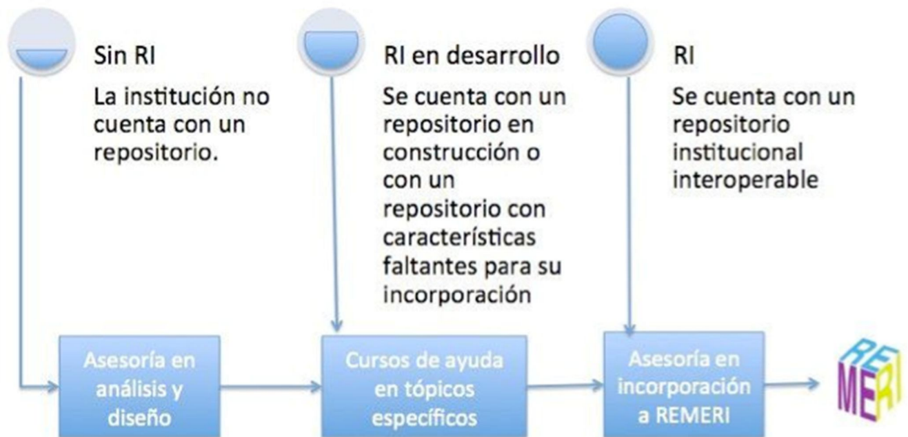
Figura 1 Clasificación de repositorios institucionales

Se tomo como unidad de información la encuesta (disponible en; http://goo.gl/5XDUc ), herramienta básica en el diagnóstico que permitió conocer la realidad acerca del desarrollo e implementación de repositorios en las Instituciones de Educación Superior en el país, con el objetivo específico de; Identificar mediante una muestra representativa las IES del país que cuentan con repositorio institucional consolidado, en proceso y los motivos por los cuales NO cuentan con repositorio institucional .